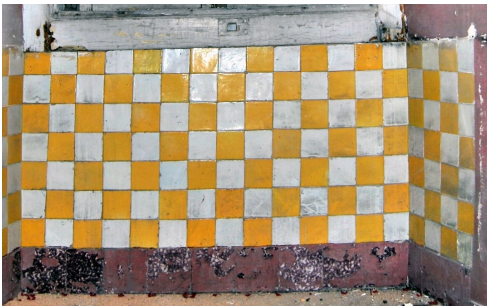
Figura 7- Axadrezado de azulejos de pequena dimensão utilizado pela Fábrica Roseira em diversas combinações de cores. Estes pequenos azulejos amarelos foram utilizados, tanto no Beau Séjour , como no Palácio Pena (aqui datados de 1867) em revestimentos exteriores.