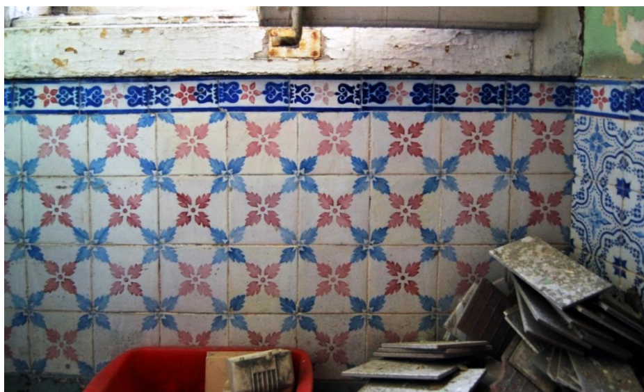
Figura 8- Padrão comum da Fábrica Roseira, muito copiado por outros fabricantes, utilizado no Beau Séjour nas cores vinho e azul escuro e também, nas cores amarelo e verde, no Palácio da Pena, estes datados de 1867