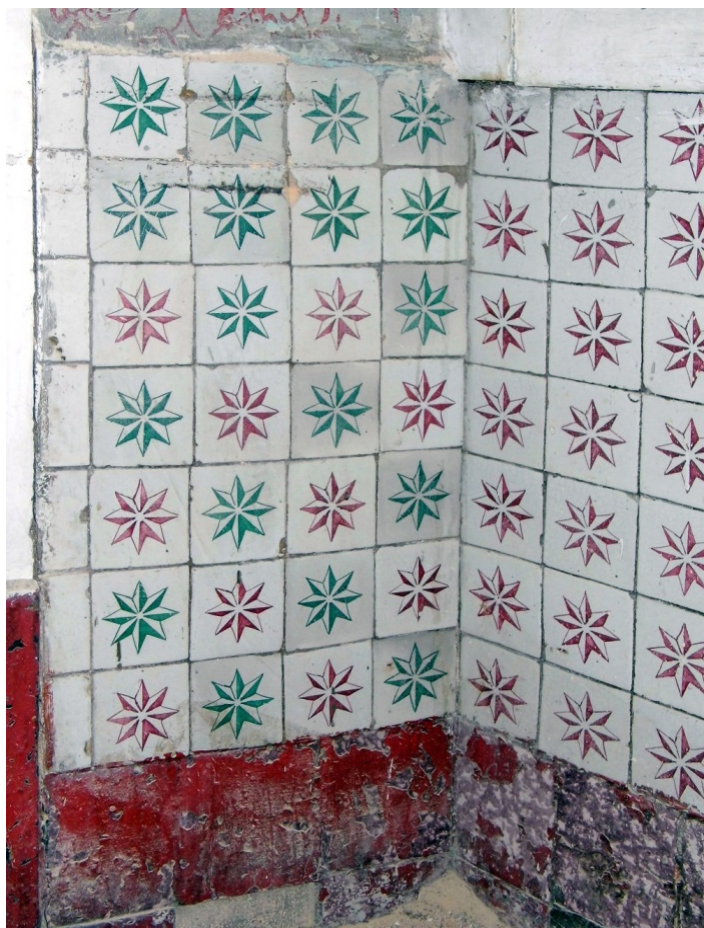
Figura 6- Azulejos de pequenas dimensões (cerca de 8 cm) com padrão estrela idêntico e na mesma combinação de cores utilizada no Palácio da Pena e para aí enviados em 1867. Estes azulejos não têm defeitos e constituem muito provavelmente remanescentes dos fornecimentos para a obra desse palácio.

Foram também reconhecidos padrões que ocorrem na Pena e no Beau Séjour mas em combinações de cores diferentes (figura 8), em aplicações semelhantes às apresentadas noutras áreas de serviços ou de lazer e ainda diversos azulejos soltos.