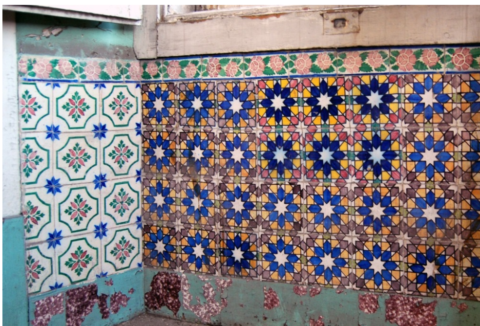
Figura 5- Azulejos de padrão neo-mourisco utilizados na Fonte dos Passarinhos e na fachada do Palácio da Pena. Note-se, nesta imagem, a existência de uma segunda combinação de cores, utilizando um pigmento rosa em vez do vinoso de manganês, que não se conhece da Pena, bem como o friso (padrão de rosas) também com a cor defeituosa.

Igualmente produzidos cerca de 1867 para o preenchimento da Sala de Jantar do Palácio da Pena (era então proprietário Eugénio Roseira, irmão do dono da “Casa das Bolas”), são os azulejos em forma de estrelas, em verde e rosa, que também se podem encontrar numa outra janela deste edifício (figura 6). Sabemos pela documentação que para o Palácio foram fornecidos cerca de 11.500 unidades [6].