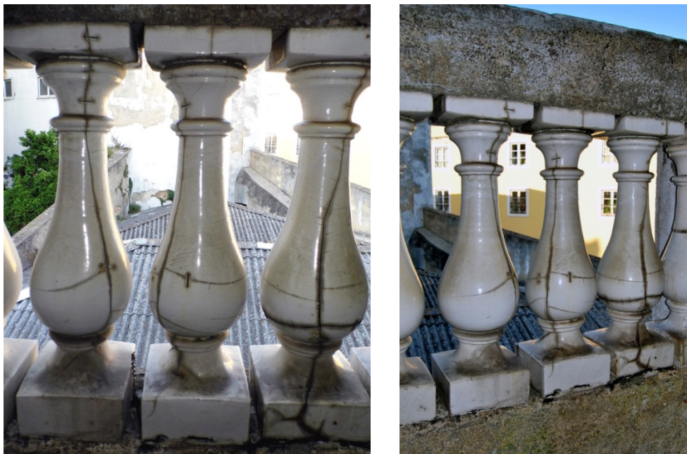
Figura 2- Balaústres cerâmicos colocados no remate da fachada da “Casa das Bolas” e onde são visíveis as inúmeras fracturas e gatos que indiciam o seu reaproveitamento

lhe conhecemos. É possível que a real ou imaginada “falta de meios pecuniários” (sic) possa explicar o reaproveitamento de um variado número de elementos cerâmicos que aqui se encontram. Na verdade, para compreender o conteúdo da Casa das Bolas convém considerar primeiro a balaustrada do último piso (figura 2).