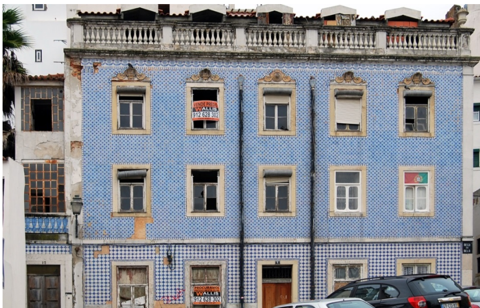
Figura 1- A “Casa das Bolas” na época em que se encontrava em venda (Nov. de 2012)