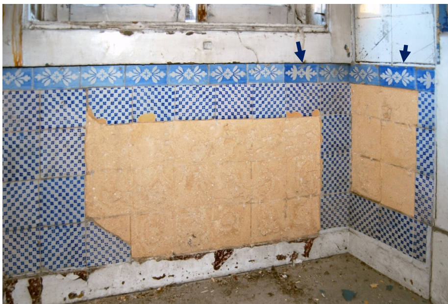
Figura 4- Padrão de pequenas flores azuis usado no Beau Séjour e em outros edifícios desde, pelo menos, o início da década de 1850. Neste caso os azulejos de fachada não parecem defeituosos, mas os do friso, um padrão muito utilizado pela Fábrica Roseira, sim: o azul de cobalto tem um tom demasiado claro ou a decoração incompleta (como ocorre com aqueles que surgem sinalizados na imagem).