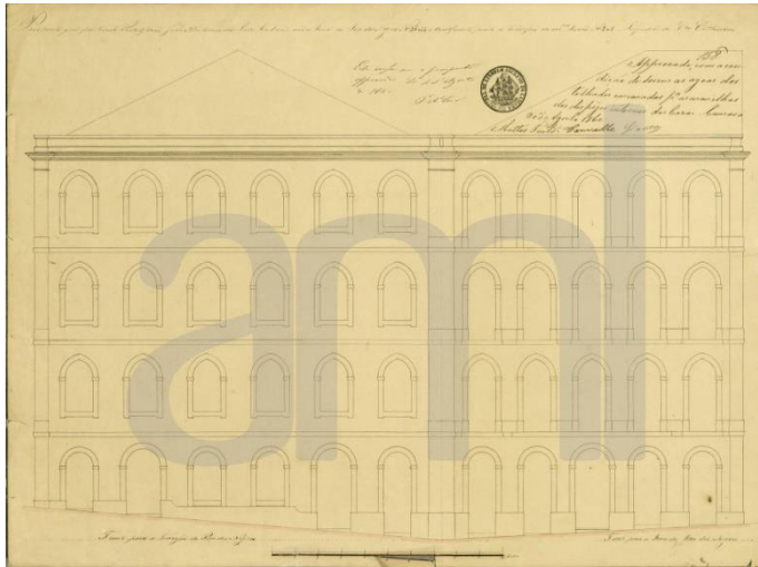
Prospeito de 1860