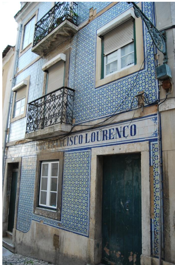
Rua Vicente Borga 7-9, Lisboa