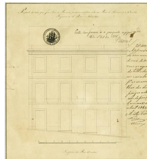
Prospeto de 1866