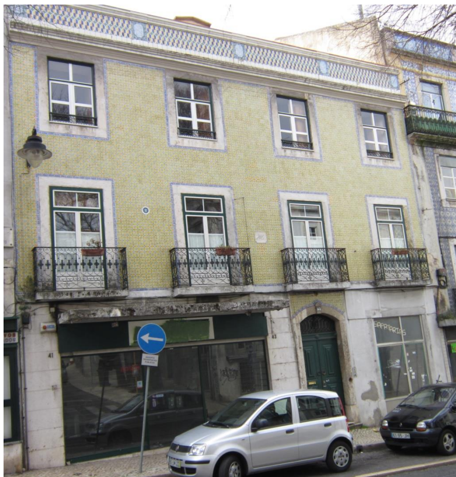
Rua Prior do Crato, 41-47, Lisboa