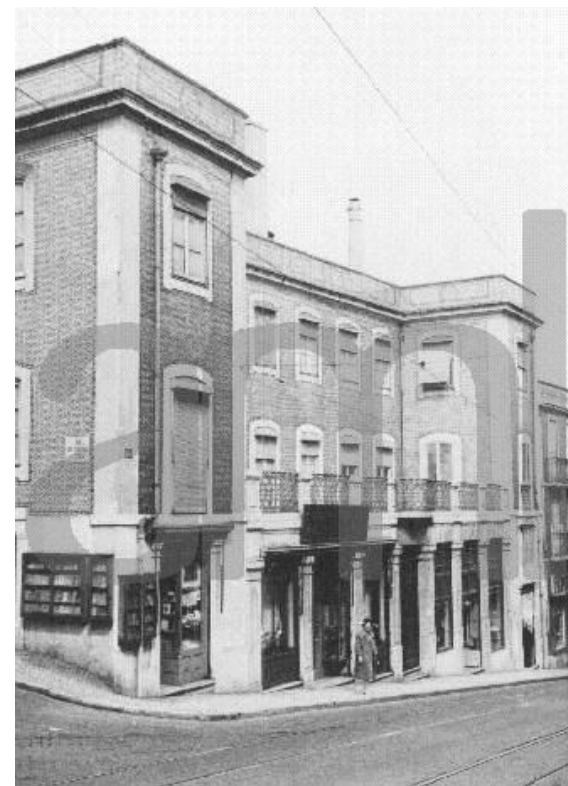
Imagem de arquivo, 1961