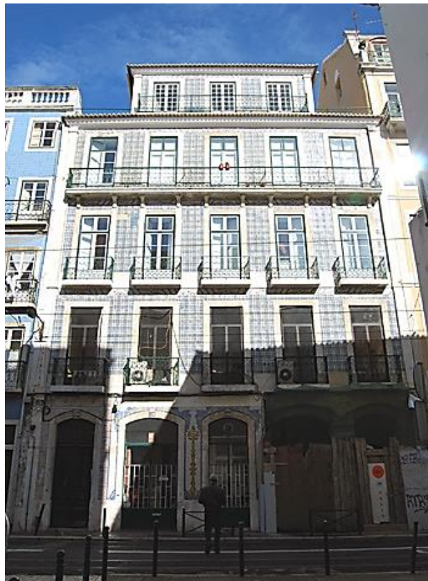
Rua da Boavista, 132-142, Lisboa