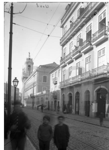
Imagem de arquivo, 1898-1908