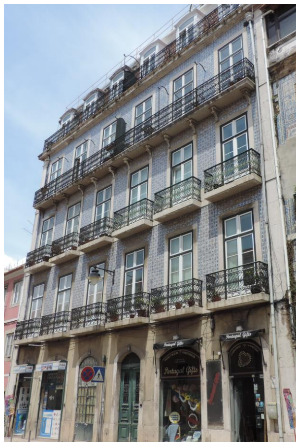
Rua Presidente Arriaga, 60-70, Lisboa