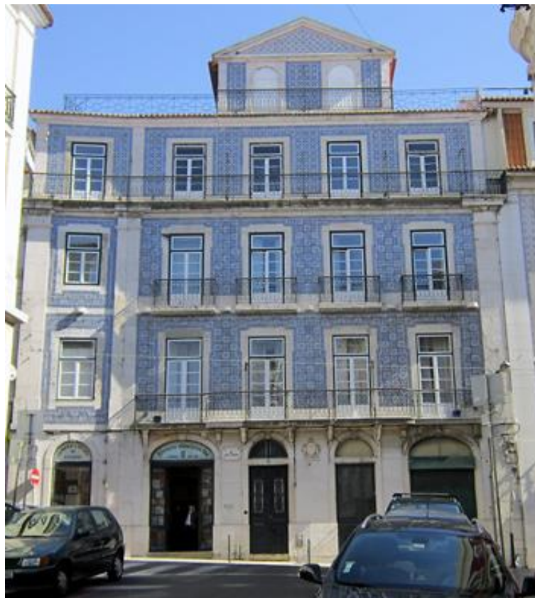
Rua Nova da Trindade, 16-16B, Lisboa