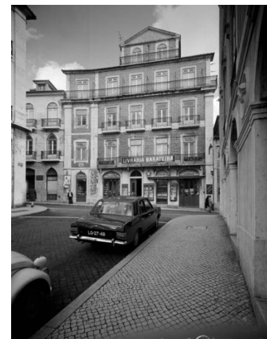
Imagem de arquivo, 1968