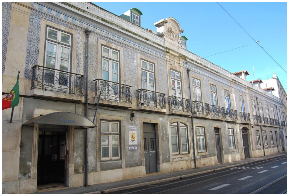
Rua da Boavista, 1-11, Lisboa