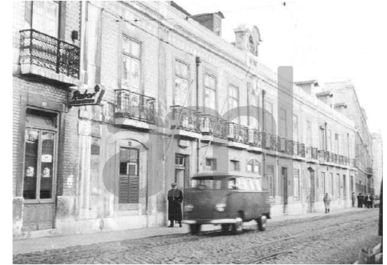
Imagem de arquivo, s/ data (AML)

O processo de obra tem início em 1919 com proposta da Câmara para ampliação do edifício da abegoaria municipal, com subida de um andar e águas furtadas' [ampliação não efectivada]. No orçamento, é referido 'azulejos de cor na fachada principal, num total de 80,30 m 2 , a que corresponde o valor 562$10' (deverá corresponder apenas ao 3º piso, significando que o 2º piso já estava azulejado.)