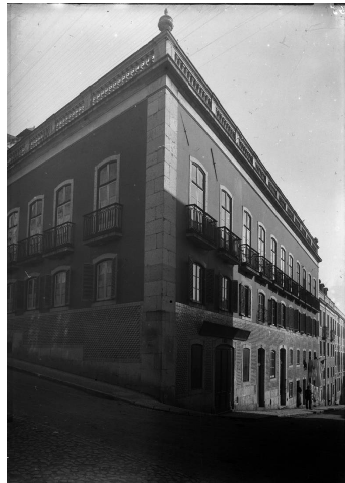
Imagem de arquivo, 1908 (AML)