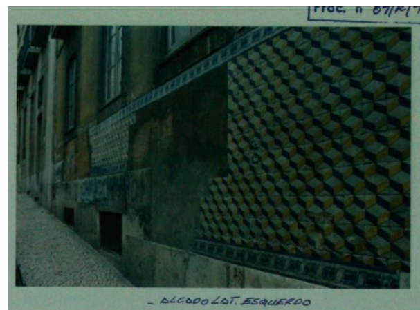
Imagens de arquivo, 1991 (AML, processo de obra 11703)