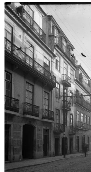
Imagem de arquivo, 1908