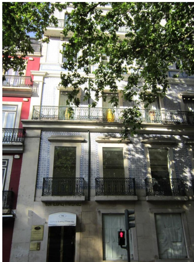
Avenida da Liberdade, 92-92B, Lisboa