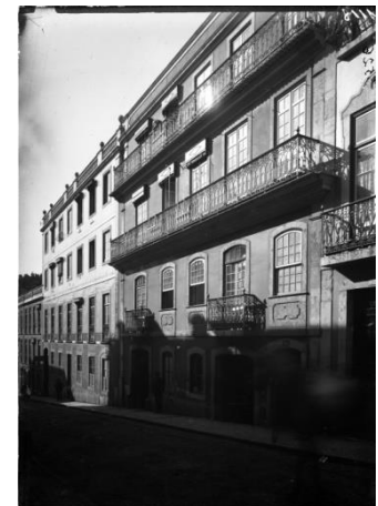
Imagem de arquivo, 1908 (b)