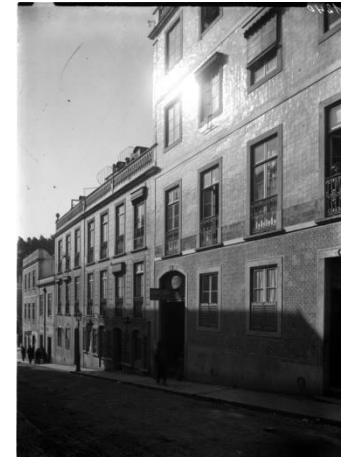
Imagem de arquivo, 1908 (a) (AML)