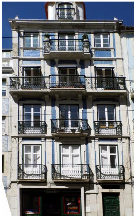
Rua de São João da Mata, 31-35, Lisboa