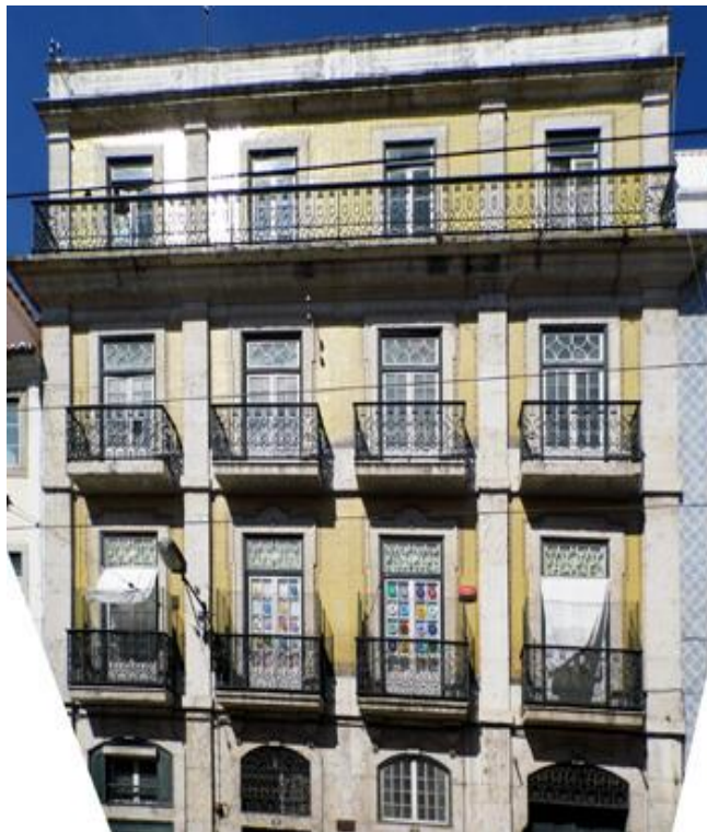
Rua de São João da Mata, 17-23, Lisboa