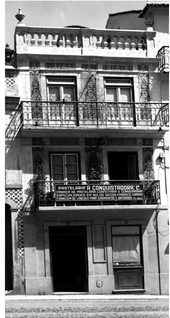
Imagem de arquivo, 1949 (AML)